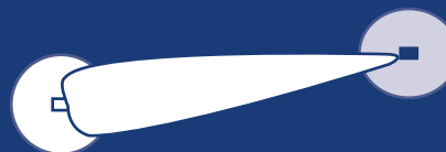
Fig. 3: Ejemplo de área de cobertura ampliada utilizando un repetidor KIRK y una Antena Directiva.